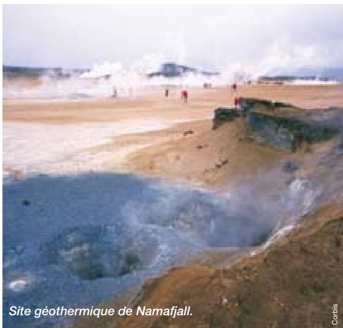
Site géothermique de Namafjall.

Les 37 km qui encerclent le lac Myvatn regorgent d'innombrables splendeurs volcaniques. Nombreux sont les touristes qui parcourent la région à vélo. Un premier arrêt s'impose à Dimmuborgir , ce champ de piliers rocheux volcaniques de 2.000 ans, aux formes